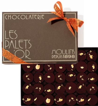
Ballotin Palets D'or

125 g – 17,00 € 230 g – 29,50 € 370 g – 41,00 € 580 g – 63,50 € 645 g – 69,00 € 875 g – 90,50 €